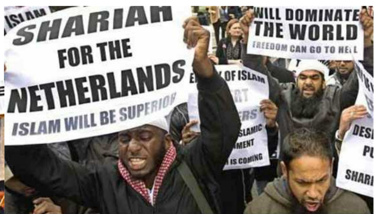
Demokratia luhistuu, sharia palaa / Sharia Hollantiin (yllä) Sharia on Iso-Britannian tulevaisuus (vas)