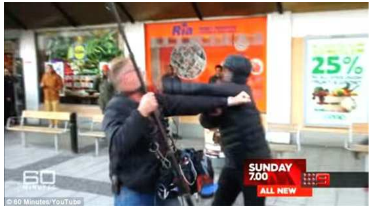
Australian 60-minutes TV-kuvausryhmän jäsenen hyökkäyksen kohteena

Terveessä kristillisessä ajattelussa kristitty ja ei-kristitty ovat ihmisarvoltaan samanarvoisia. Kaikki ovat samantyyppisiä ihmisiä vaikka kaikki eivät usko Kristukseen ja Hänen kauttaan saatavaan synnin sovitukseseen. Kristukseen uskovalla ei ole varaa ylimielisyyteen eikä toisten leimaamiseen. Asioista puhuminen ja arviointi, arvostelu niiden oikeilla nimillä ja suoraan ei kuitenkaan ole toisten leimaamista. Terve kristitty ei pyri "maailman valtaamiseen" eikä omien näkemystensä pakottamiseen muille. Hän ei myöskään ole laillista esivaltaa vastaan vaan Raamatun mukaan haluaa maansa, alueensa ja kaikkien ihmisten parasta tehden oman velvollisuutensa yhteiskunnan hyväksi. Poikkeuksena tähän on tilanne, jossa kristityn vapautta noudattaa uskoaan aletaan rajoittaa ja vainota. Mutta sellainen yhteiskunta ei enää olekaan "laillinen" eikä demokraattinen vaan yksilön- ja sananvapautta rajoittava ja ihmisarvoa tuhoava.