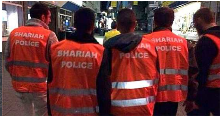
Saksassa islamistit pyrkivät saamaan sharialakia valvovat "poliisinsa" kaduille